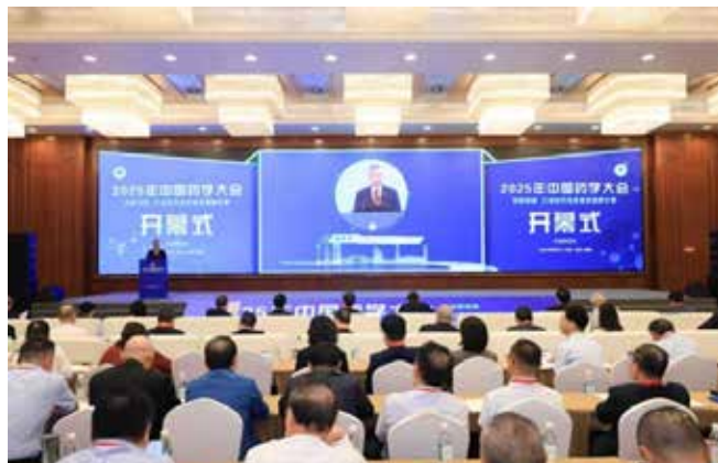
9月27日至28日，四川成都，2025年中国药学会大会

11月22日至23日在江苏南京召开，主题为“先进制剂的研究与转化”。来自全国高等院校、科研院所、制药企业、医疗机构、监管机构等