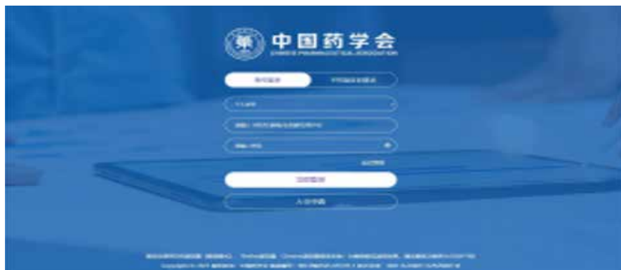
会员管理系统首页

▶ 备注：基础信息中红色部分为必填项，完善信息部分所有数据均为必填项，没有请填写“无”