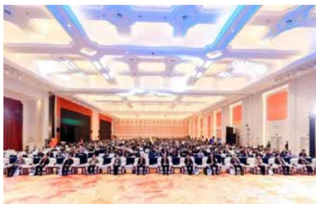
11月22日至23日，江苏南京，第十八届药物制剂大会