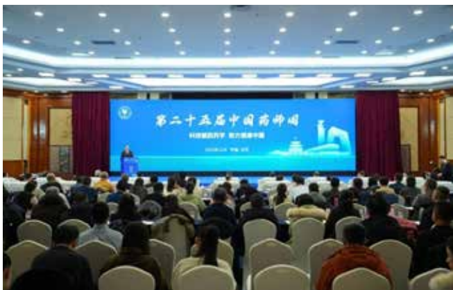
12月26日至28日，北京，第二十五届中国药师周

别作主题报告。大会同期举办6个专题学术活动、“科海扬帆 梦想启航”校园科普公益活动和2025中国药学会药学网络大讲堂（北京场）-2025年学会改革发展座谈会。