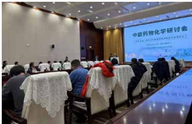
11月29日，新疆乌鲁木齐，2025年中国药学会中欧药物化学研讨会

2025年中国药学会中欧药物化学研讨会于11月29日在新疆乌鲁木齐召开，主题为“新靶点和新技术导向的原创新药研发”。会议聚焦药物化学前沿技术、创新药物研发趋势和国际合作机遇，围绕人工智能辅助药物设计、新型靶点发现、精准药物递送系统等议题开展深入研讨，推动中欧药物研发领域实现深度交流与合作，进一步深化国际科研合作网络，为推动全球原创新药研发和我国药学高质量发展提供强劲动力。