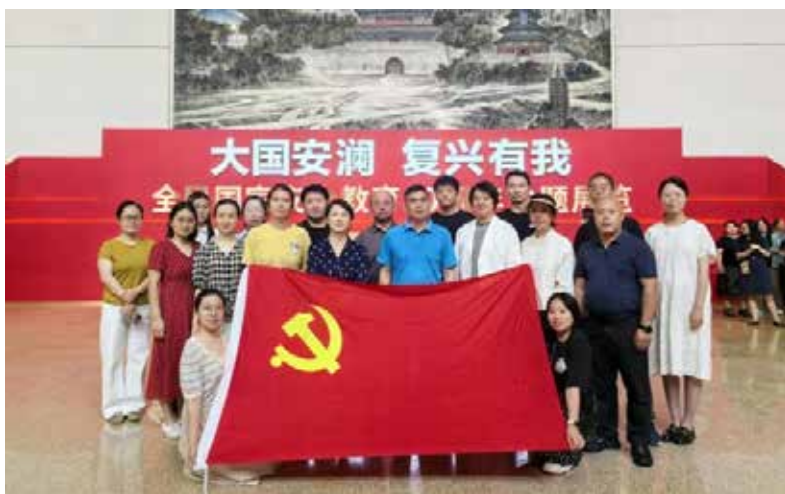
7月7日，北京，参观大国安澜 复兴有我——全民国家安全教育10周年主题展览

强化经济帮扶，投入资金支持定点帮扶地区乡村振兴建设，广泛动员帮助定点帮扶地区销售农产品；深化科技帮扶，组织新疆、西藏地区 243 名代表参加 2025 年中国药学会等学术会议，组织安徽临泉地区 100 余名基层一线药学工作者参加第二届罕见病药学研究和服务能力提升培训班，着力提升当地药学服务水平和医疗服务能力，助力定点帮扶和援疆援藏地区巩固拓展脱贫攻坚成果，推动医药健康事业发展。