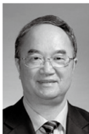
名誉理事长 桑国卫